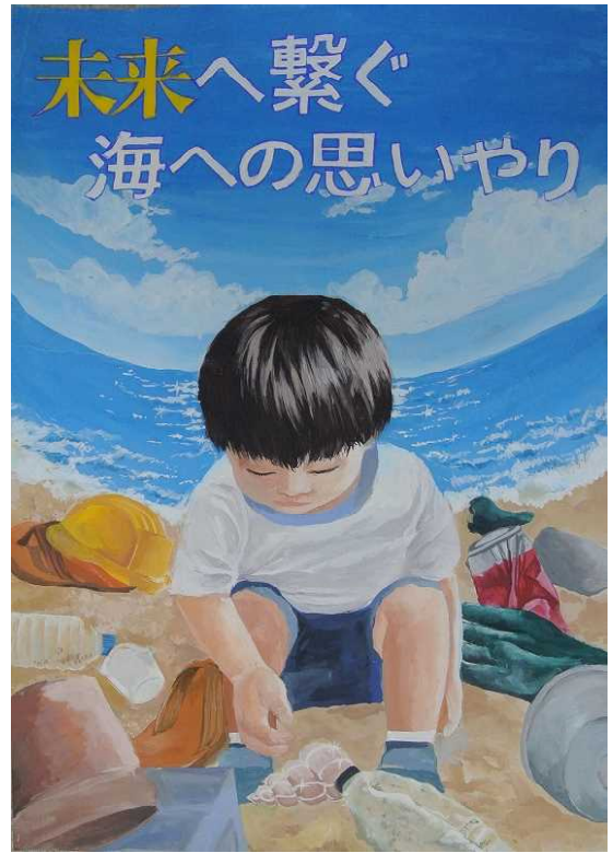
佳作 帯刀 陽万里 射水市立新湊中学校

3 Rを守らないと地球温暖化が進むため、再使用、再利用、リサイクルをみんなにしてほしいと思いこのポスターをかきました。