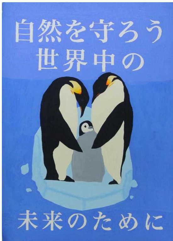
佳作 能澤 舞桜 黒部市立清明中学校