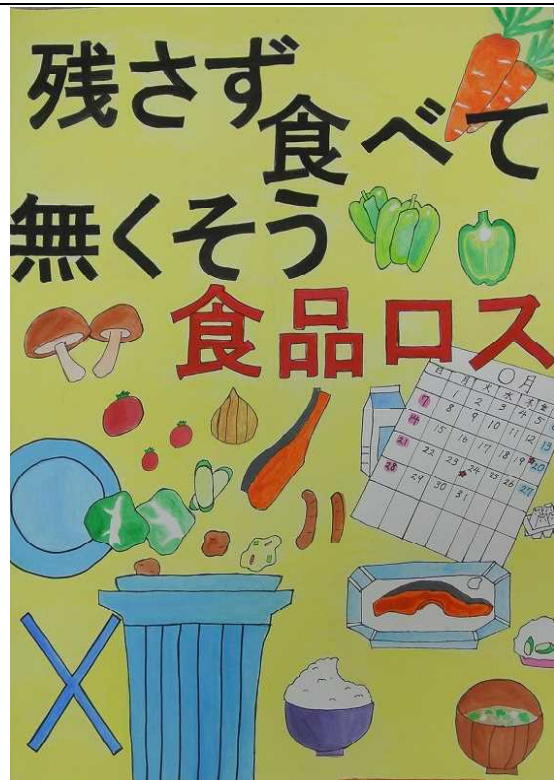
佳作 生駒 美結 滑川市立早月中学校

美しい富山を守るために、ポイ捨てをやめて欲しい。また、ごみは、リサイクルしたり、リユースしたりして海へ流れるごみを無くして欲しい。